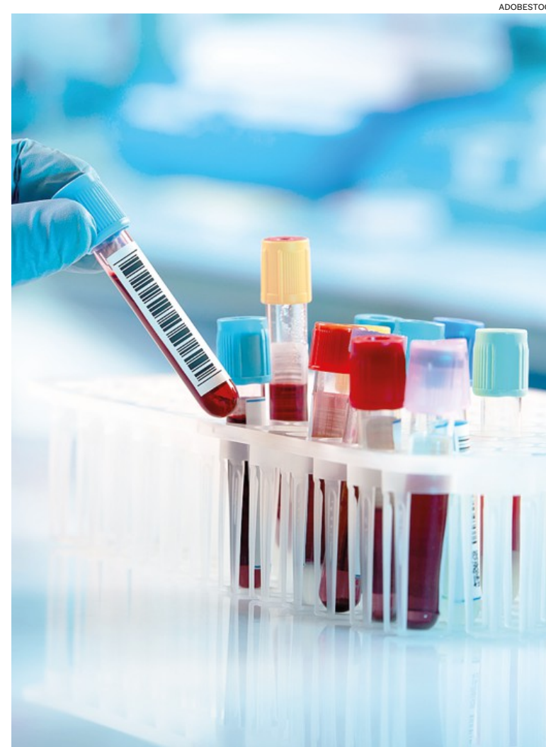
One shot. Con un solo sequenziamento l'AI scopre diverse malattie